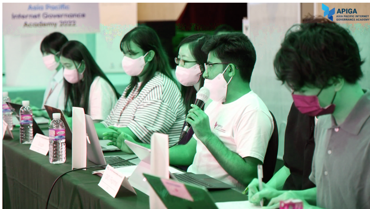
圖 3 ICANN 模擬會議 - GNSO 組

(RySG)，剛好與我參與的非營利利害關係團體 (NCSG) 分屬不同「院」(House)，能為學員帶來平衡看法。在短短 4 天內，目睹 GNSO 組的學員從對 DNS 濫用一無所知，到最後一天模擬會議時，不僅能清楚闡明自身立場，更能與不同立場的其他組代表理性討論、據理力爭，著實令人驚艷。