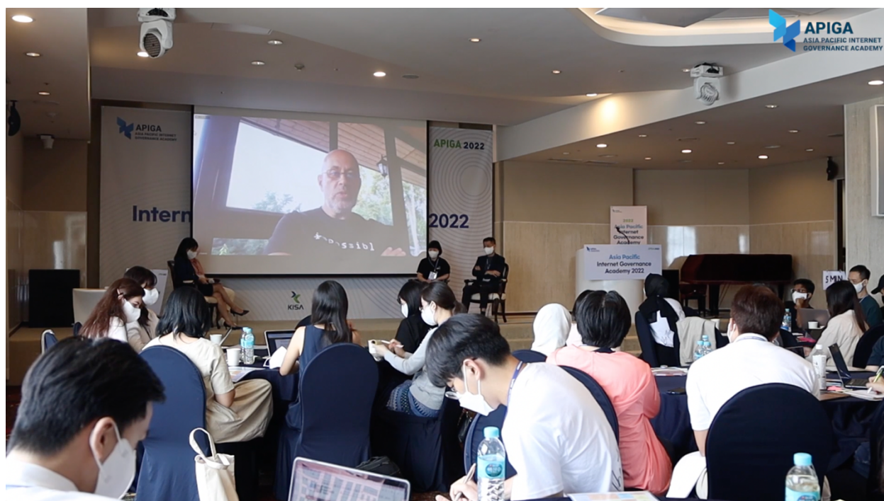
圖 2 APAC Community Leader's Panel (2)

相較於其他與談人，我參與網路治理的資歷尚淺，或許因為如此，也可明顯感到分享内容不同。如在主要挑戰中，其他與談人皆認為最主要的挑戰是推廣網路治理，激起年輕人對參與網路治理的熱情與興趣，並延續、發揚光大多方利害關係模式的治理精神。不同於此宏大願景，我分享自己面臨的最大挑戰是語言障礙，要使用不熟悉的英文與其他英文母語者爭論、捍衛立場，對我來說才是最大挑戰。事後許多與會者私下向我表達最能共感我的分享，也因此更有勇氣面對語言障礙的挑戰。